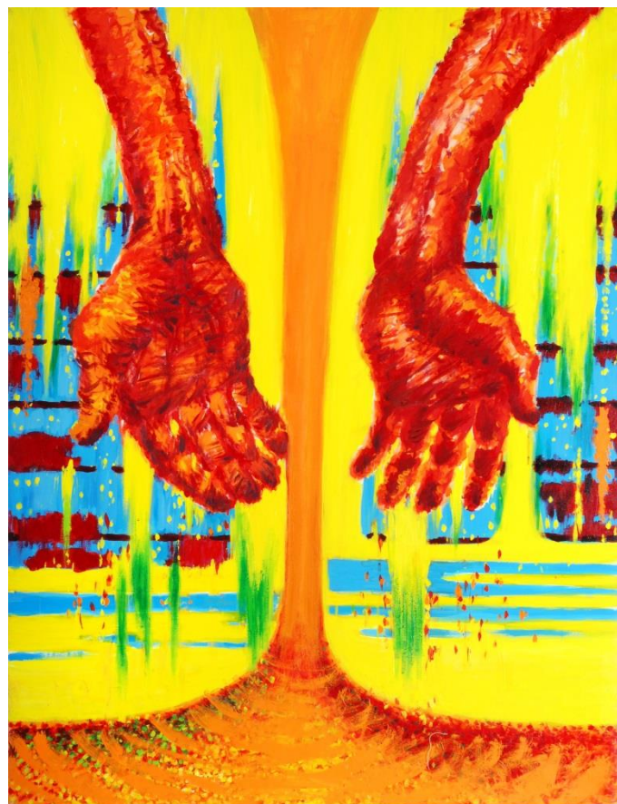
Roke moje mame, 100 x 130 cm, akril na platnu, 2007