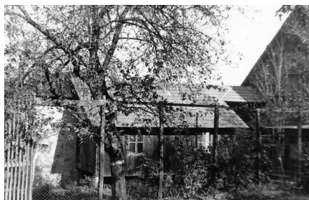
Čebelnjak na grajskem vrtu, 1955.