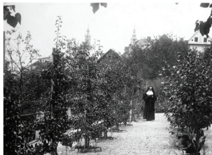
Gojenke ob votlini lurške Matere božje, grajski vrt, pred 1914.