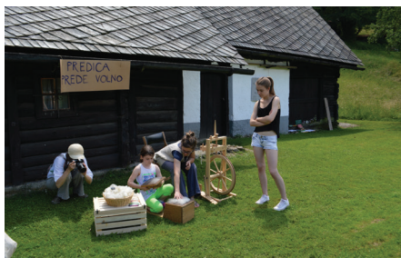
Delavnica Od zrna do kruha, Škoparjeva hiša, 2010.