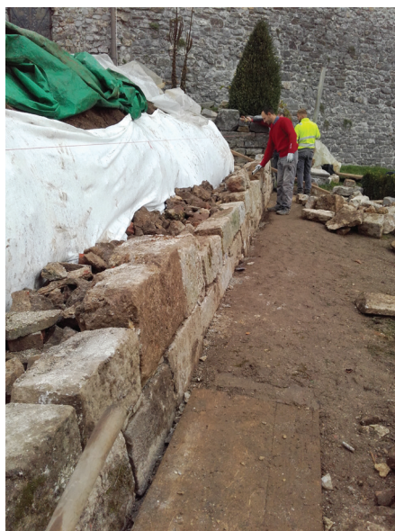
Obnova suhozidu in opore za vrtnice, foto M. Kavčič.

Nekaj obdelanih kamnov smo prihranili za izdelavo klopi na vrtu, tako da so te sedaj mnogo bolj izvirne od kupljenih. Nedokončana sta ostala še izdelava vodnjaka in senčnice – ta mora