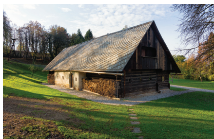
Mlin na grajskem vrtu.