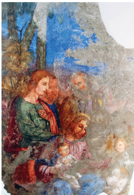
Freska Jezus z otroki, sredina 19. stoletja. Hrani Loški muzej Škofja Loka.