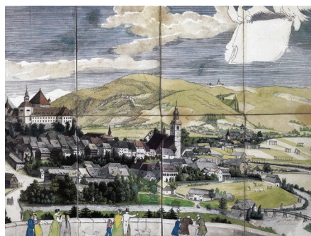
Škofjeloški grad, detajl Merianovega bakroreza, 1649.