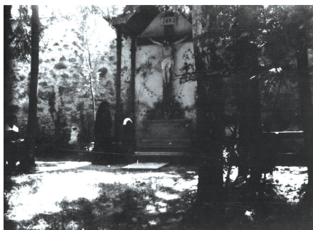
Gojenke v lipovem drevoredu, kjer so bile postavljene mize in klopi, grajski vrt, začetek 20. stoletja.