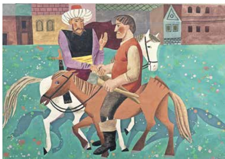
Martin Krpan Frana Levstika, Mladinska knjiga, 1964, gvaš