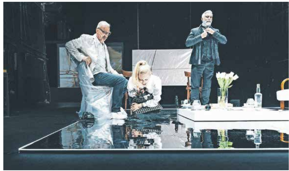
Srečanje dveh zakonskih parov sčasoma razkrije najtemnejše plati njihovih osebnosti.

Občutek imam, da so bila osemdeseta leta prejšnjega stoletja med najbolj ustvarjalnimi in svobodnimi v zgodovini slovenske popularne glasbe. Mislim, da je to dejstvo. Nekaj podobnega bi lahko rekli tudi o sedemdesetih letih, ko so kraljevali Buldožer in še prej Kameleoni. Sedemdeseta leta so bila uvod v glasbeni razcvet ustvarjalnih osemdesetih let. Tudi Pankrti smo največ dosegli v osemdesetih letih. Osemdeseta so bila zato tako plodovita, ker se je odpiral nov svet, ko so se širila območja svobode. Te je bilo v številnih primerih več kot zdaj.