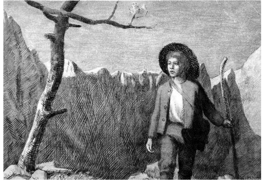
Risba za špico filma Kekec, 1950, tuš, zasebna last