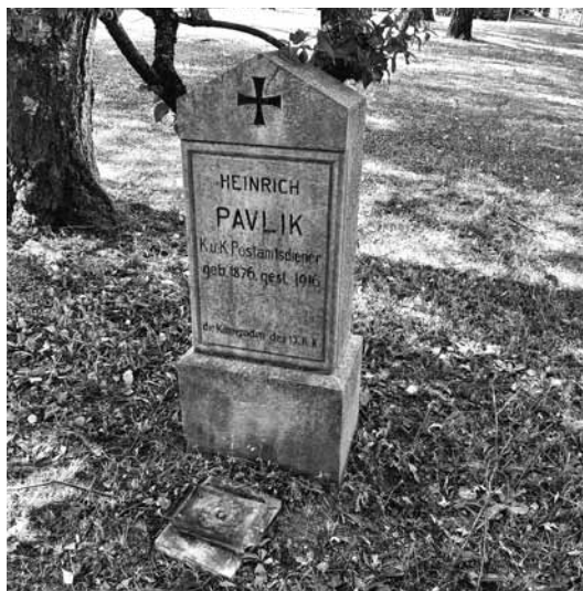
Foto 5: Zadnji kamniti nagrobnik, ki še stoji na loškem vojaškem pokopališču, 2022.