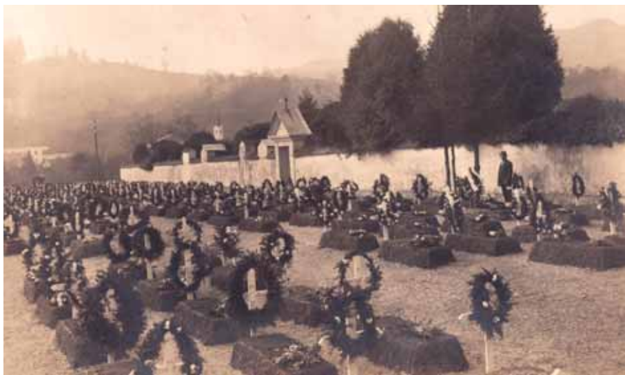
Foto 7: Vojaško pokopališče ob mestnem pokopališču v Škofji Loki, pred letom 1928.

Umrle vojake so pokopavali tudi na drugih civilnih pokopališčih v okolici Škofje Loke. Eno takih je bilo v Žabnici, kjer je bilo na severozahodnem delu pokopanih 15 vojakov. 53 Na civilnem pokopališču na Trati pri Gorenji vasi je bilo pet vojaških grobov (štirje na severozahodnem in en grob na južnem delu izven pokopališkega obzidja). 54 Po narodnosti so bili na Trati pokopani štirje češki vojaki, dva vojaka nemške in en madžarske narodnosti. 55 Načrt pokopališča v Selcih priča, da je bil na južnem delu pokopan en vojak madžarske narodnosti. 56 Na pokopališču v Stari Loki pa sta bila pokopana dva avstrijska vojaka. 57