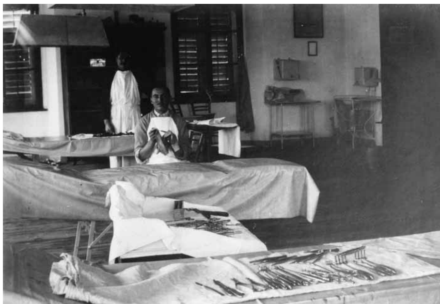
Foto 1: Pogled v notranjost operacijske sobe v vojaški bolnišnici na Loškem gradu, 1915–1918.