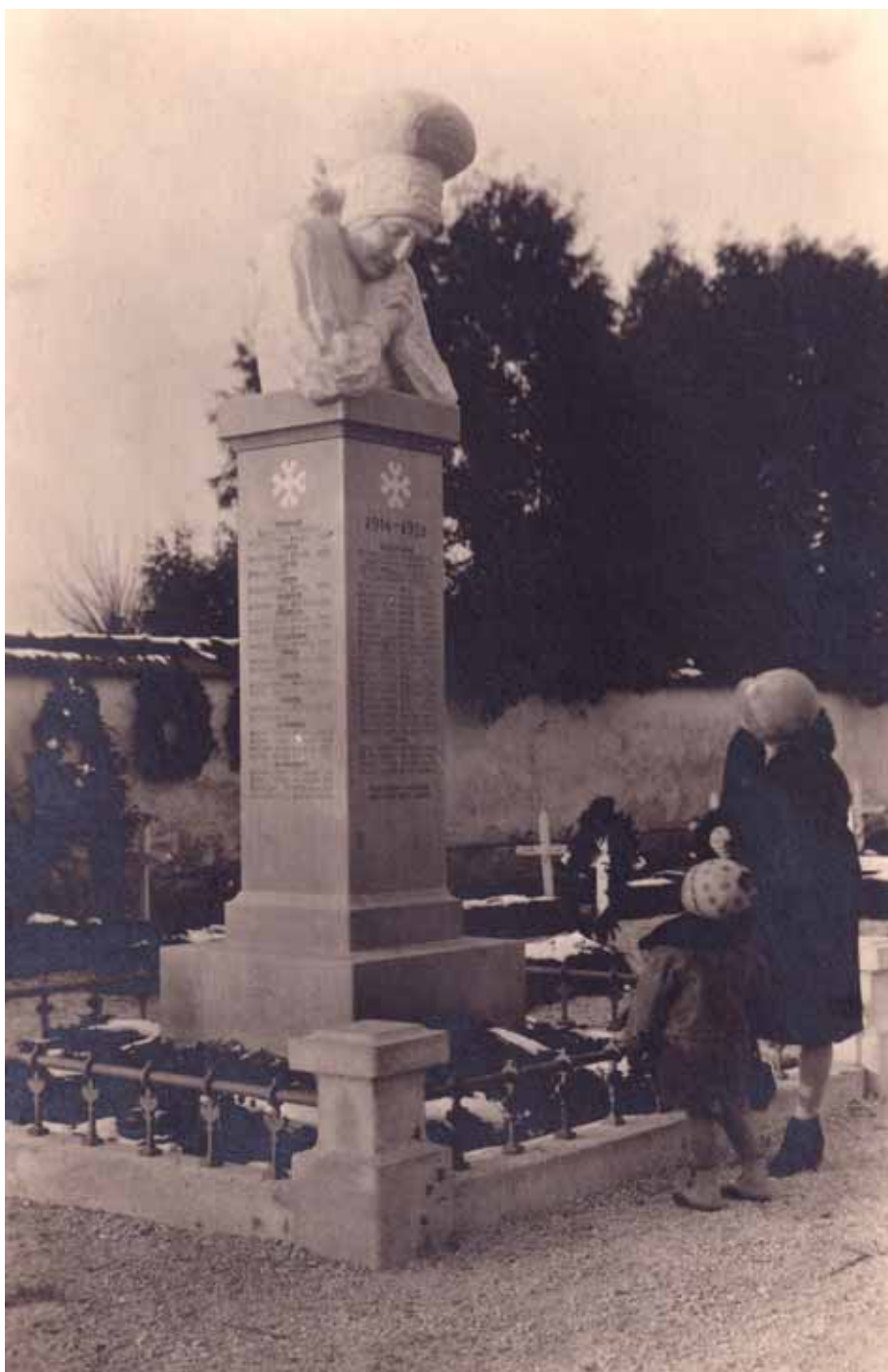
Foto 8: Spomenik padlim v prvi svetovni vojni ob mestnem pokopališču v Škofji Loki.