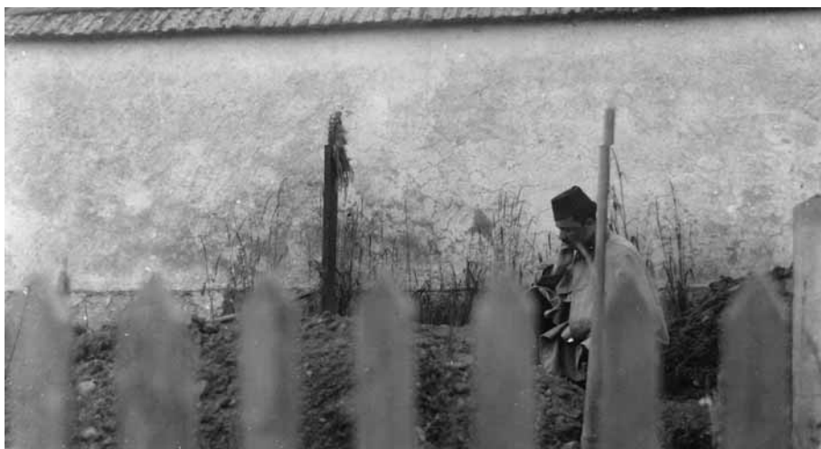
Foto 6: Vojak pri verskem obredu na pokopališču v Škofji Loki, 1915–1918.

sme in ne more ugoditi.« 46 Pokop nekatoličana na katoliškem pokopališču je bil dovoljen le v sili: »... ko bi v vojnem času ali ob kužni bolezni na pokopališču za nekatoličane odločeni prostor ne zadostoval.« 47 V primeru pokopa nekatoliškega