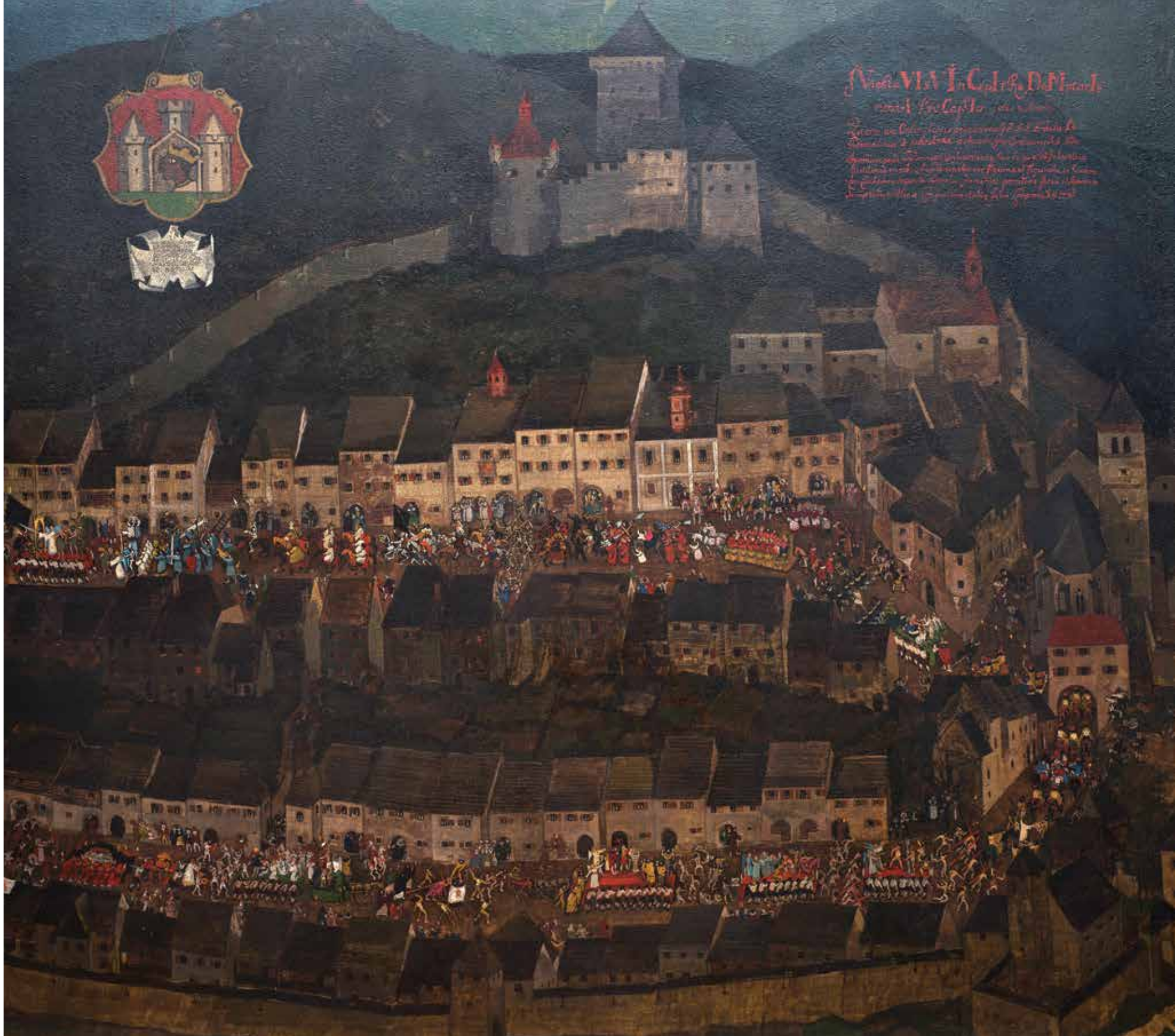
Škofjeloški pasijon, Boris Kobe, 1967, olje na platnu. Hrani Slovenski gledališki Inštitut, Ljubljana.